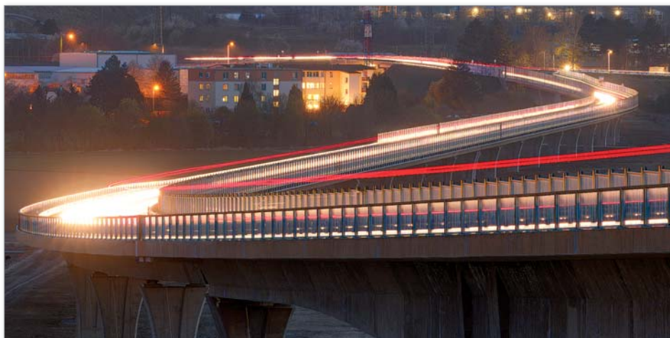
Západní obchvat Plzně