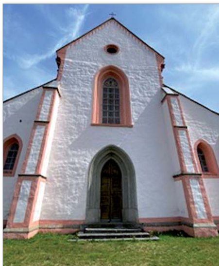
Nepomuk Kostel sv. Jana Nepomuckého

lokátoři. Najdou místo, vyměří náměstí – nejdůležitější část města, kde se konají trhy, vytvoří síť ulic. Budoucím obyvatelům přidělí dle německého práva místa pro domy, obchody na úzkých gotických parcelách. Velmi rychle zde staví nové měšťané domy se sklepy, studnami, sklady. Po příkladu krále zakládají města i kláštery a šlechtické rody. Královským městem je Stříbro, Sušice a samozřejmě Klatovy, Domažlice, Tachov a roku 1294 nová Plzeň. Do konce 13. století je v západních Čechách 31 měst. Města rozvíjí obchod, řemesla. Přichází do nich nové měšťanské řády: minorité do Stříbra, do Žlutic dominikánky, do nové Plzně minorité a dominikáni, do Manětína johanité. Některá města vznikají u starších hradů – Tachov, Přimda, Prácheň, Bor, Domažlice. Nové hrady staví šlechta po celém území kraje.