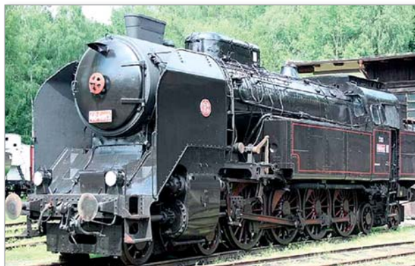
Tendrová parní lokomotiva, ČSR 1938

válce nastal zásadní přechod na civilní výrobu. O tomto úkolu diskutoval s vedením Škody v Plzni i T.G. Masaryk. Škoda se zaměřila na strojírenství, např. na výrobu parních lokomotiv, automobilů, na elektrotechnický průmysl. Po celou dobu 1. republiky byla jedním z největších podniků. Hospodářskou krizí začátku 30. let překonala Škodovka vývozem průmyslových celků do Asie a latinské Ameriky.