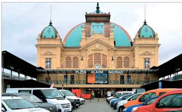
Plzeňská památkově chráněná budova nádraží po rekonstrukci

Ale opusťme Plzeň a podívejme se do kraje. Hospodářský rozmach v Plzni v 2. polovině 19. století zpomalil rozvoj ostatních