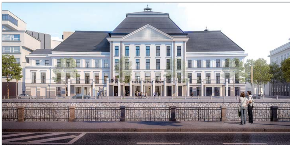
Vizualizace bývalých městských lázní na Denisově nábřeží v Plzni

nové budovy v podobě betonového proskleného monolitu. Realizace stavby byla odkládána především z důvodu nedostatku financí i pochybností zastupitelů o navrženém umístění s minimálními možnostmi parkování. I s pochybnostmi o vhodnosti budovy v daném prostoru. Vliv měla i nemožnost získání případných dotací na realizaci. Pro další postup byla rozhodující zejména diskuze Starostů a hejtmána Josefa Bernarda. Z ní vyplynulo, že pokud má Plzeňský kraj investovat do města Plzně velké vlastní prostředky, musí to být na projekt, který na desetiletí či staletí vnese do kraje a krajského města novou kulturní kvalitu. Na projekt, který skloubí prezentaci výtvarného umění s živou kulturou, který vtáhne do tvůrčího kulturního dění děti a mladou generaci, do projektu, který poskytne zázemí i těm, kteří chtějí navazovat na tradiční lidovou kulturu regionu. Podstatnou myšlenkou bylo i to, že takto velká investice by měla mít městotvorný charakter. Měla by být příkladem oživení města v místě, které je degradované, které je