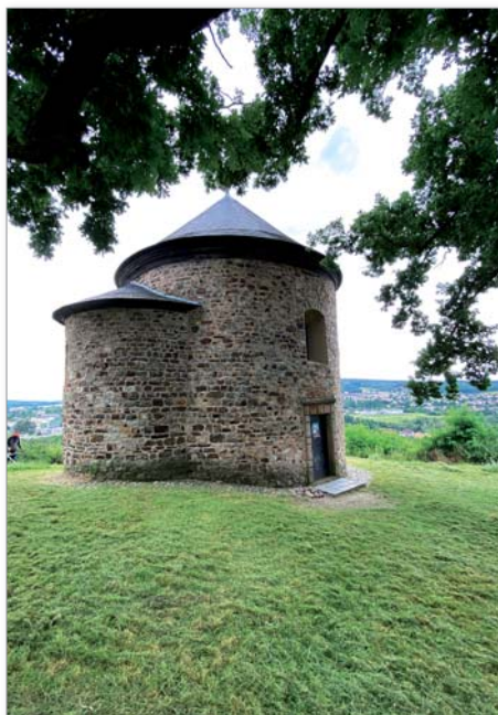
Rotunda sv. Petra a Pavla ve Starém Plzenci

První historická zmínka o staré Plzni je z roku 976. Některá hradiště se v té době stávají základem hradske soustavy. Jedním z hradišť, hradů je stará Plzeň s románskou rotundou – nejstarší dochovanou stavbou v kraji. Později s kostelem svatého Vavřince, svatého Kříže a dalšími. Postupně hrad Plzeň roste v centrum kraje. Rozvíjí se podobně jako Praha. Pod výšinou s dvorcem, hradem vzniká osídlení po obou březích řeky – malá Praha západních Čech – Plzeň. V 10. století se stará obchodní cesta z Prahy na Plzeň stává hlavní magistrálou spojující Malopolsko a Kyjevskou Rus se západem. V Plzni se dělí cesty na Řezno a Norimberk – Bamberg. Dnes vedeme v té první trase dálnici.