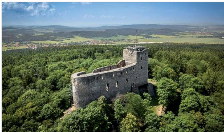
Mohutná zřícenina hradu Radyně – Starý Plzenec, Plzeňsko, Západní Čechy

A v pralese byla dobývána půda pro pastviny i pro orbu. Živobyť z půdy podél cest a řek začalo být chráněno opevněnými body a hradišti. Celkem více než dvaceti.