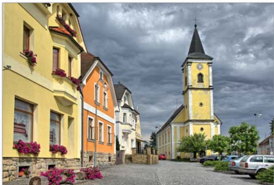
Bělá nad Radbuzou