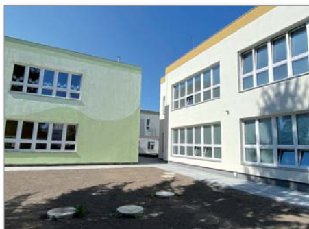
Školka ve Spáleném Poříčí

Pamatuji si velmi dobře na spolupráci obcí s okresním úřadem, v mém případě Plzeň-jih. Okres byl pro obce poradním místem, informoval v době předdigitální o změnách zákonů. Poskytoval obcím vzory úředních listin, smluv, rozhodnutí a dokázal poradit i s ekonomikou, úvěry, rozpočtem, majetkem. Okresní shromáždění se zastoupením části starostů rozhodovalo o dodatečných vyrovnávacích dotacích. S respektem vzpomínám na přednostu okresu doktora Červeného, který se s městy a obcemi vstřícně dohodl na tom, že co největší část dodatečných peněz půjde na společné potřeby obcí a samotný okresní úřad bude co nejvíce šetřit na svém provozu. Peněz bylo málo, a tak se zvolily priority. Každá obec se školou dostala příplatek na každého žáka, byla zčásti podpořena ztrátová autobusová doprava, z níž měli užitek všichni a dopláceli na ní tak z obecních rozpočtů méně. Každoročně byla podpořena na tehdejší dobu vysokou částkou obnova památek. Tuto dotaci dříve či později potřebovala každá obec a podařilo se tak včasnými drobnými zásahy zastavit chátrání mnoha památek a zamezit tak budoucím větším škodám. Na základě této